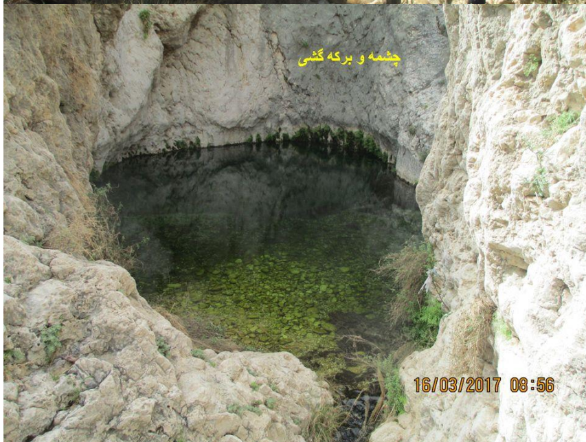
چشمه و بركه گشي