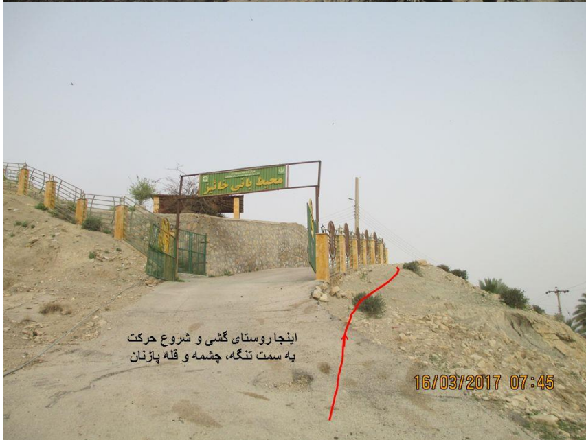
اینجا روستای گشی و شروع حرکت به سمت تنگه، چشمه و قله پازنان