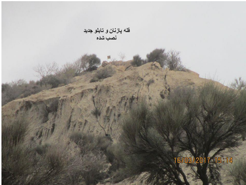
قله پازنان و تابلو جدید نصب شده