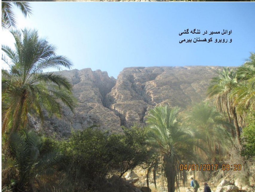
اوانل مسير در تنگه گشي و رويرو كوھستان بيري مي